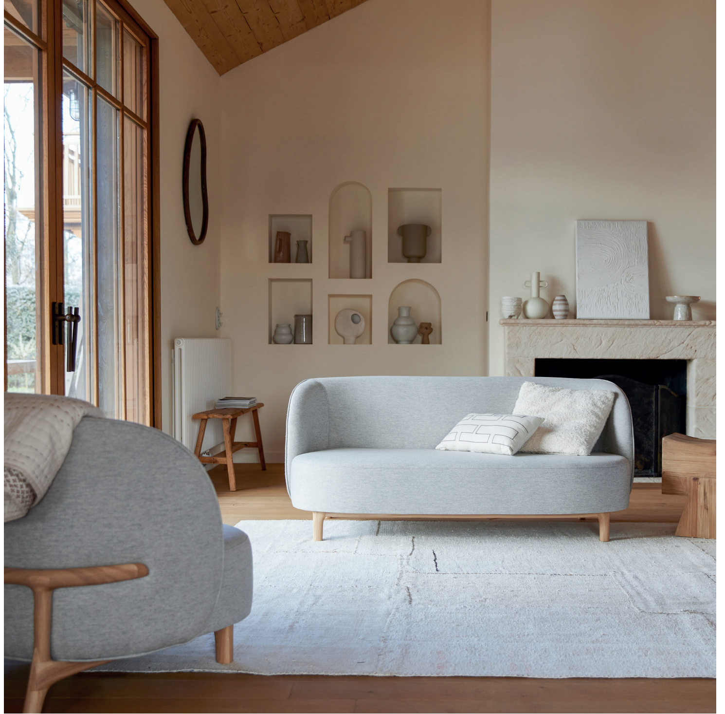
Hoya — Canapé en chêne massif et tissu deux places