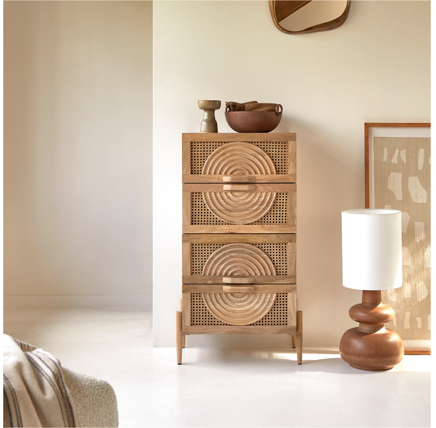
Sina – Commode en manguier massif et rotin

Imaginées par le bureau de style interne, les pièces sont façonnées à la main grâce à des techniques d'assemblages traditionnelles. Chaque pièce s'inscrit dans le programme RSE de tikamoon : tikagreen. Ce dernier vise une parfaite transparence entre le client et la marque et permet de connaître le progrès et les initiatives menées pour réduire l'impact de la production et de la livraison sur l'environnement.