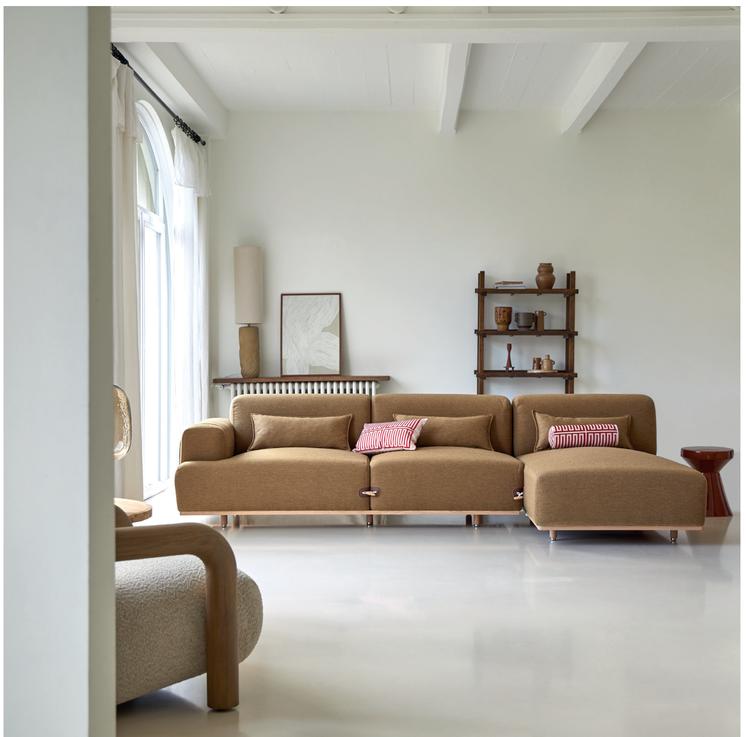
Duffle — Canapé d'angle droit en tissu et chêne