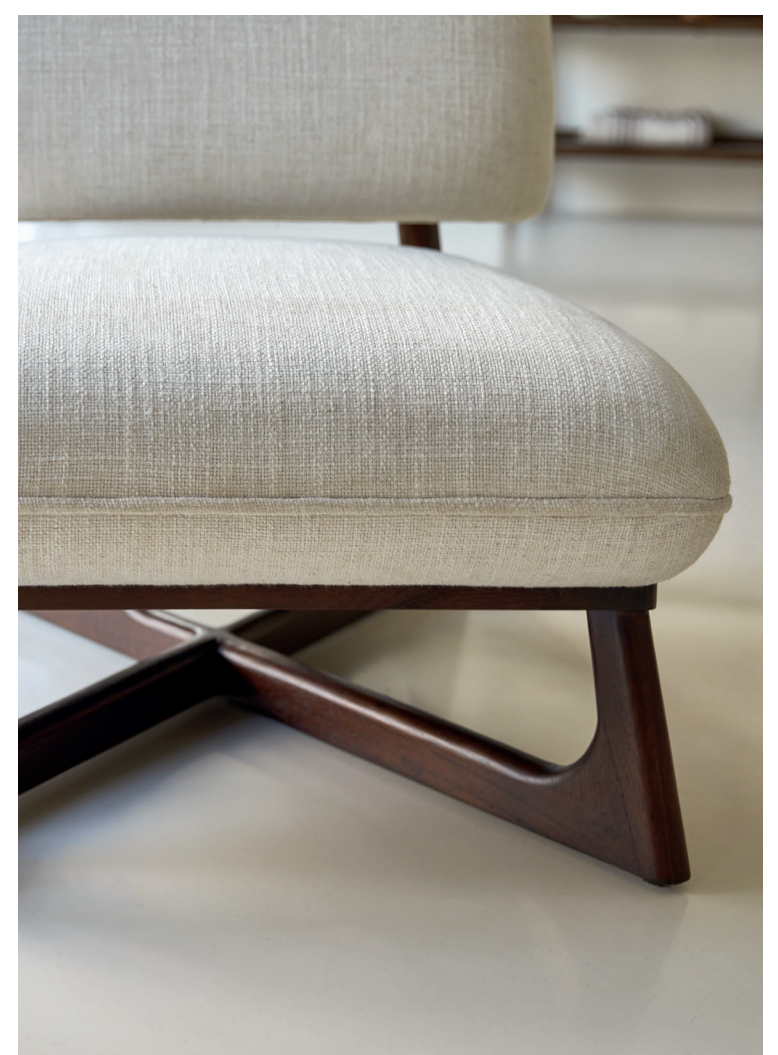
Brune — Fauteuil bas en mindi massif et tissu