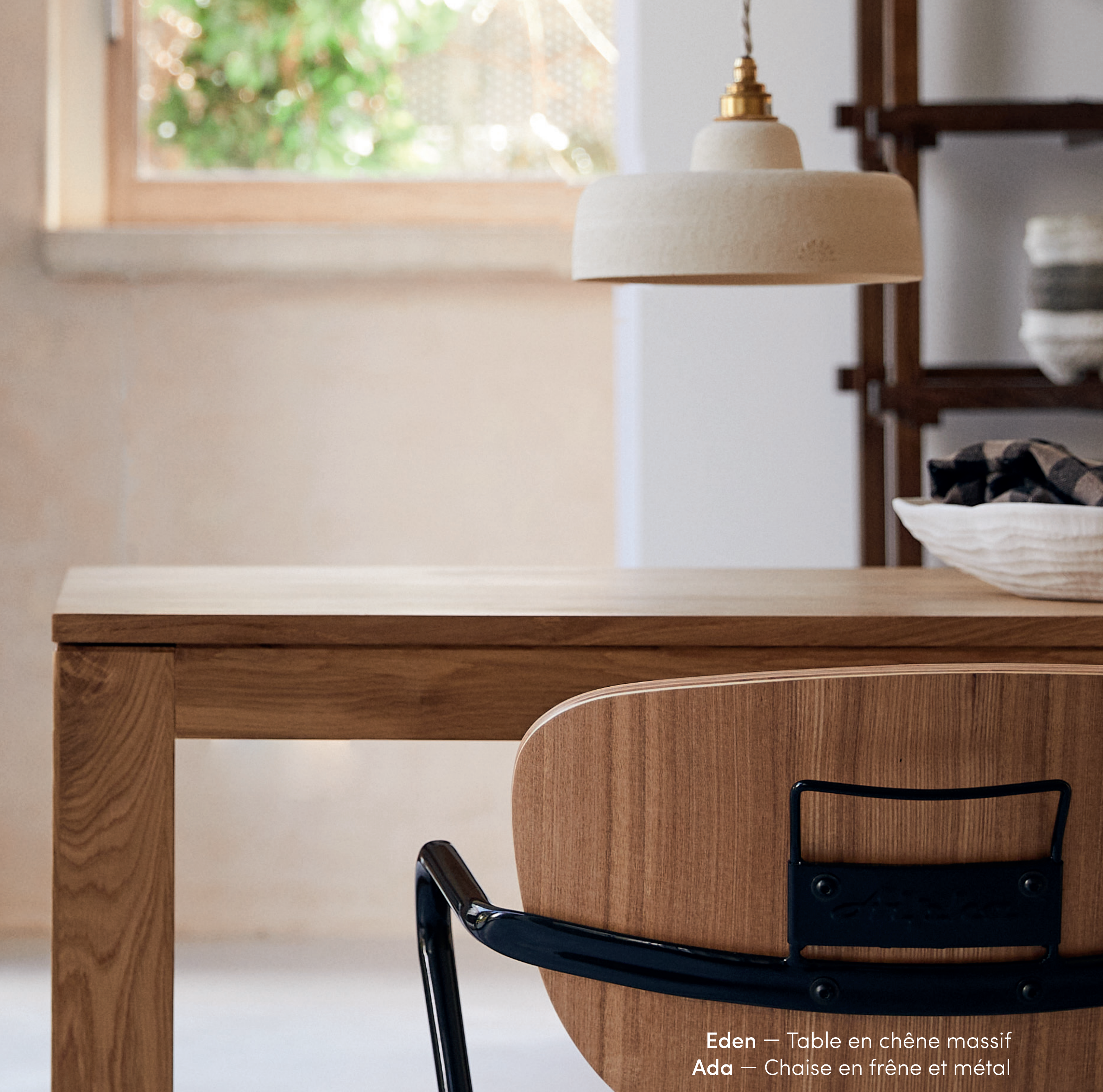
Eden — Table en chêne massif Ada — Chaise en frêne et métal