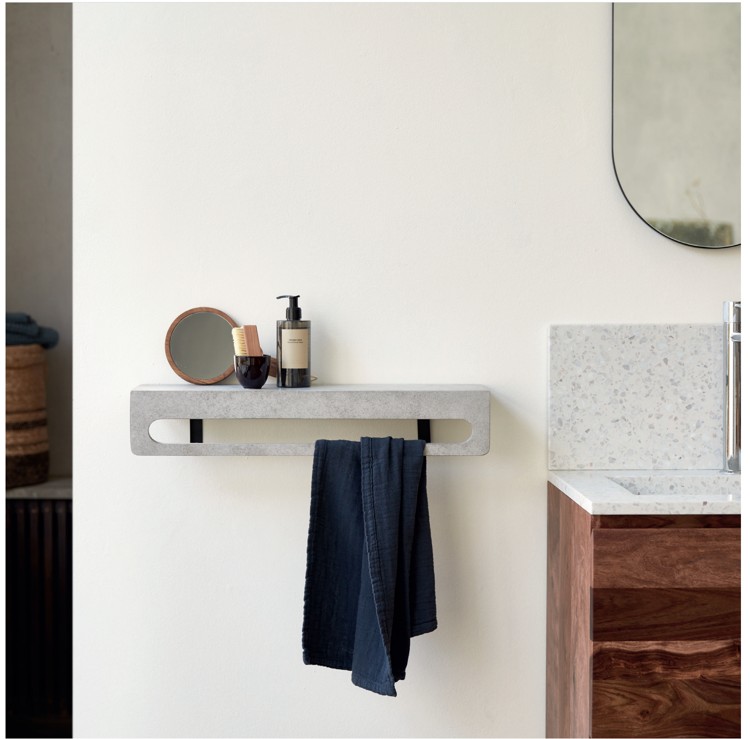
Nova — Meuble de salle de bain en palissandre massif et terrazzo premium Ava — Crédence en terrazzo premium | Clea — Porte-serviette mural en béton

Mettre sa salle de bain au diapason n'a jamais été aussi simple ! Et comme il est important de s'y sentir bien, tikamoon a finement réfléchi à son aménagement et ses possibilités quelle que soit sa taille. Qu'il s'agisse d'une grande salle de bain familiale ou d'un point d'eau attenant à la chambre parentale, tikamoon offre un large choix de mobilier durable et design conçu à partir de bois aussi esthétique que résistant. Meubles sous vasque ou suspendus, porte-serviettes, miroirs, étagères, colonnes, et également un large choix de vasque en marbre, céramique, béton, pierre de rivière et terrazzo premium sont à découvrir sur le site et en boutique.