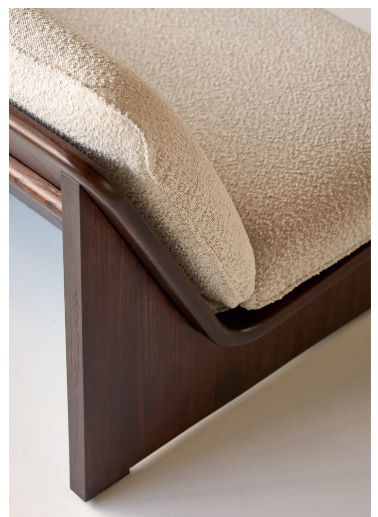
Folk — Banquette en mindi massif et tissu deux places