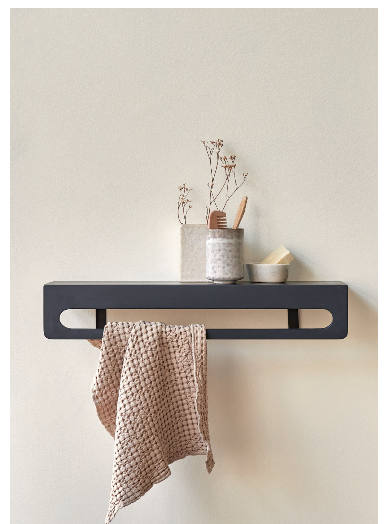
Jonàk — Meuble sous vasque en teck massif | Milos — Vasque en terrazzo premium Ava — Crédence en terrazzo premium | Clea — Porte-serviette mural en terrazzo