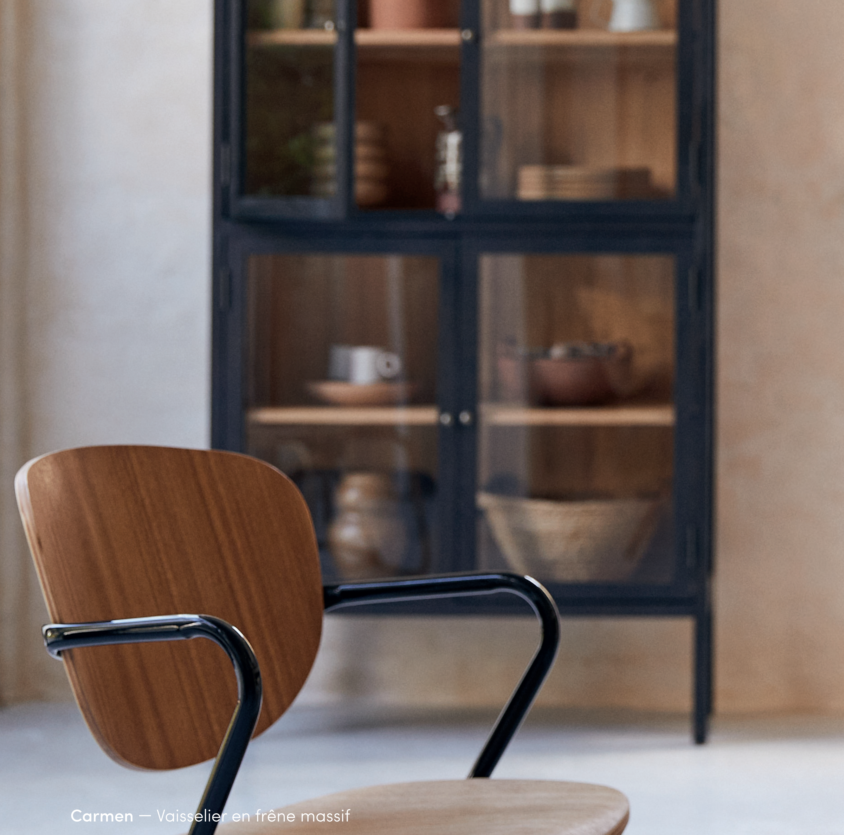
Carmen — Vaisselier en frêne massif