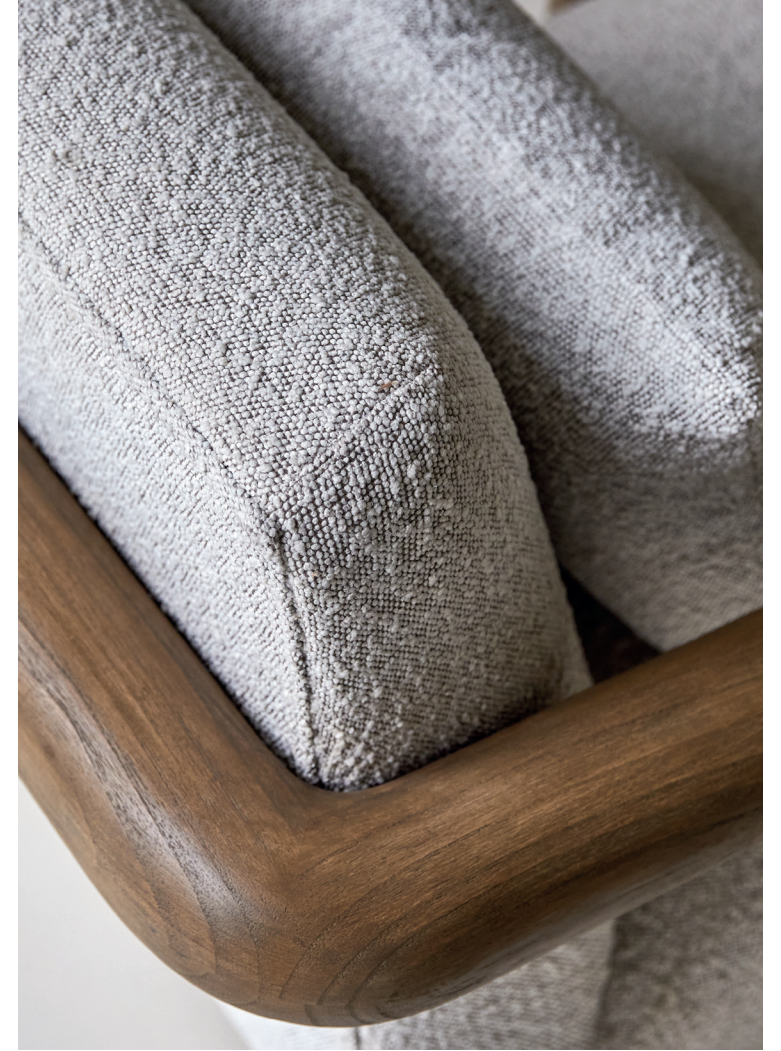
Nina — Fauteuil bas en mindi massif et tissu