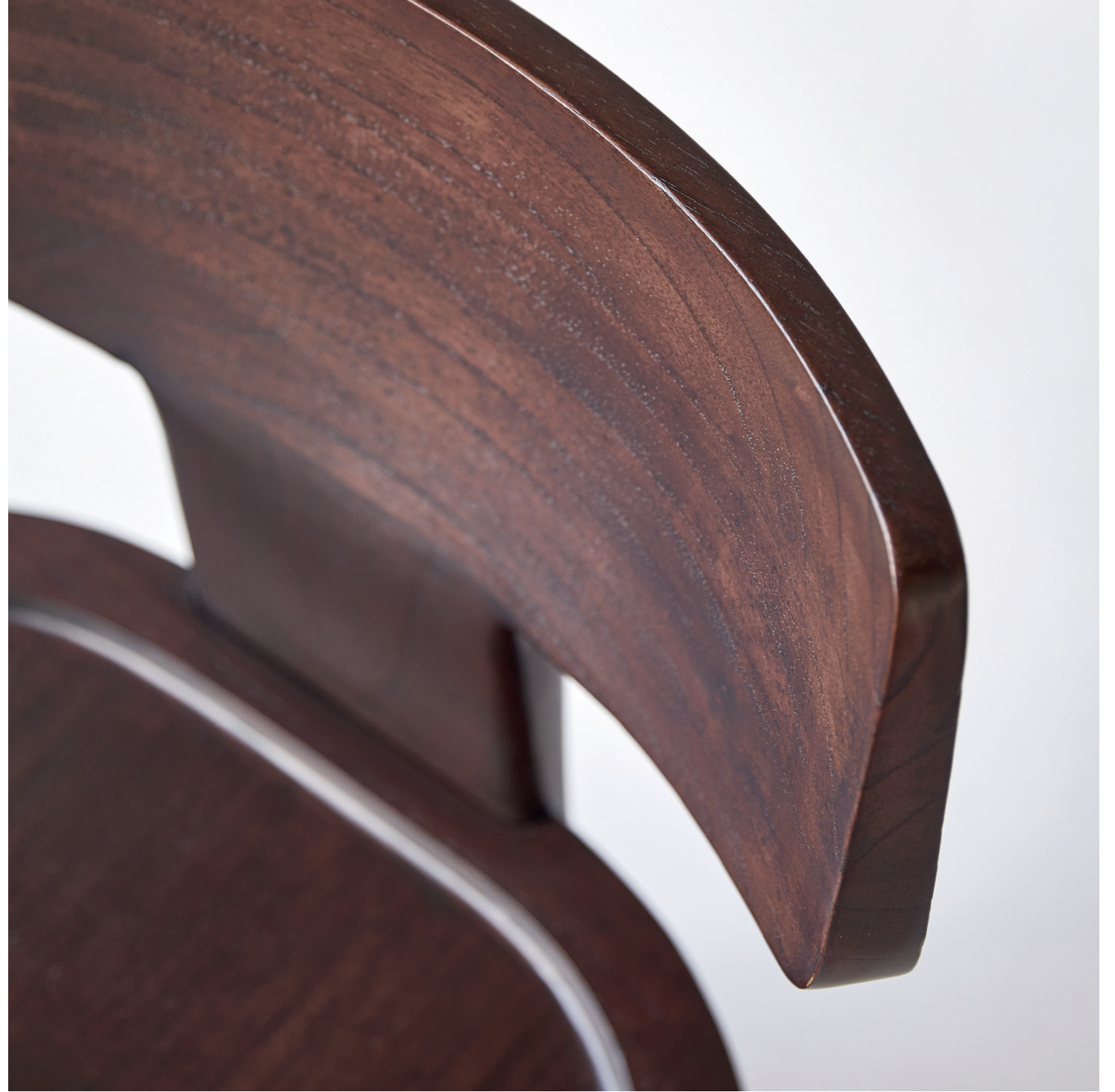
Iko – Chaise en mindi massif

Le résultat ? Une plongée immersive au cœur d'une forêt « décortiquée » qui fait la lumière sur les multiples ressources de l'arbre comme source inépuisable de créations et de sensations. Autour de cinq mobiliers tikamoon qui attestent de la belle utilisation du bois massif, le feuillage, la sève, les fruits, l'écorce ou encore les produits dérivés que sont, par exemple, le fusain ou le broux de noix démontrent la capacité de la forêt à enchanter nos quotidiens en faisant appel à nos cinq sens.