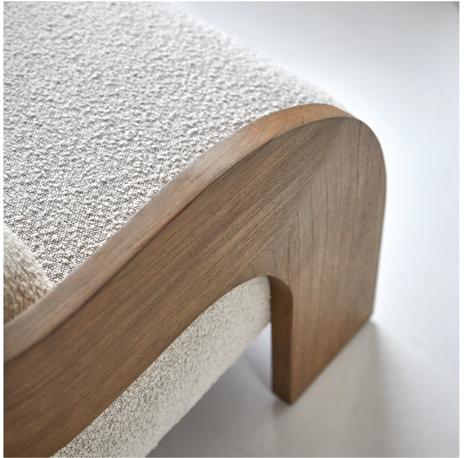
Boti — Fauteuil en mindi massif et tissu