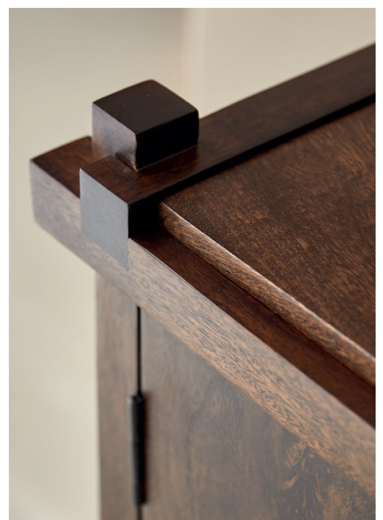
Arko — Buffet en manguier massif